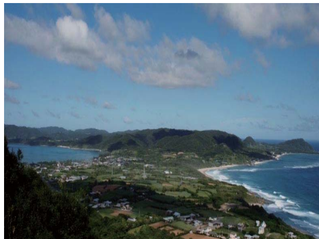
[大島郡龍郷町赤尾木] 右に太平洋, 左に東シナ海を望む。海で隔てられていた龍郷と笠利が長い年月のうちに海流によって砂が運ばれて繋がったと言われている。