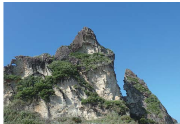
[鹿児島県十島村小宝島] 島の中心に竹山(標高102.7m)がそびえる。全体的に著しい風化が進み、鋭い形をした山肌(火成岩)が見られる。